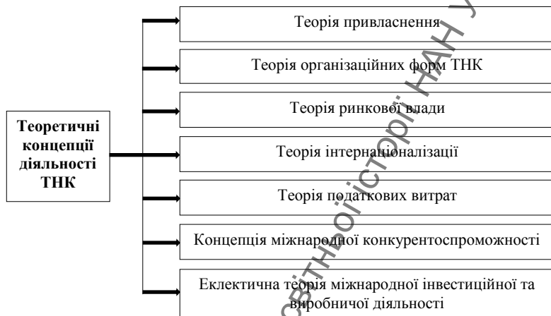
Рис. 1. Теоретичні концепції діяльності ТНК

перетворюються на наднаціональні об'єднання, які переслідують одну мету – максимізацію прибутку шляхом встановлення економічного господарювання в світовому масштабі. Головний чинник – вихід на нові ринки збуту. Прихильниками концепції були М.Акої та І.Самсон.