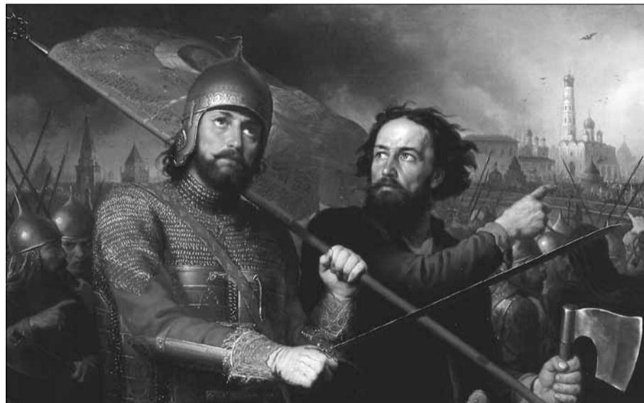
Міхал Скотті. Мінін і Пожарський (1850; Нижньоновгородський державний художній музей)

які у двадцяти-тридцять роки минулого століття закладали його підвалини. Важить для цього зіставлення і та обставина, що обидва нові перетлумачення євразійства є мало дотичними до теорій впливового пізносоветського історика-дисидента, етнологіста та географа Льва Гумільова, що їх іноді теж вважають «євразійськими».