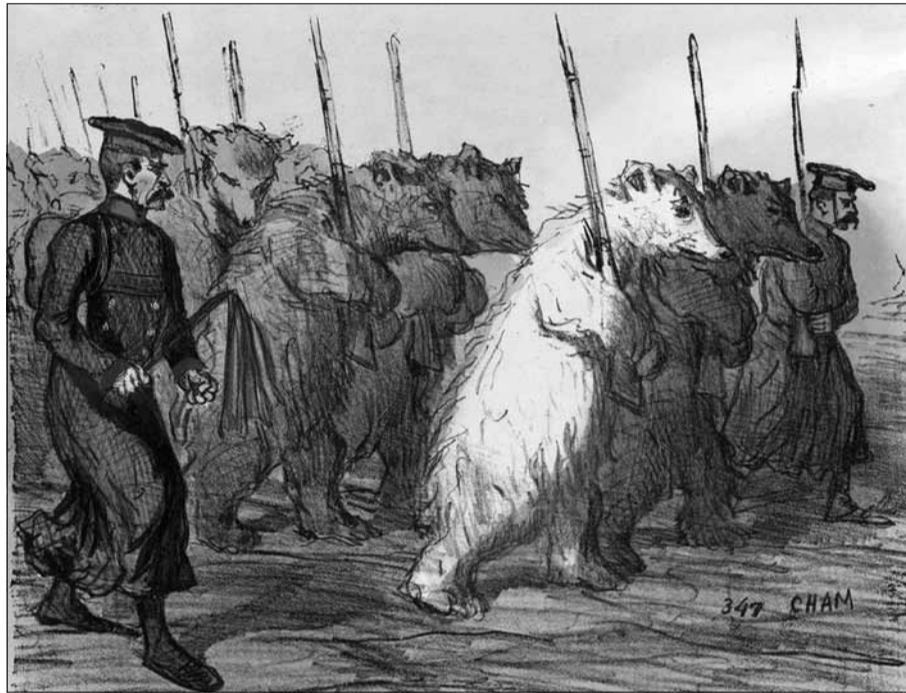
Оноре Дом'є. Резервна армія російського імператора (з циклу «Козаки-посміховиська»; 1853)

«єдині регіони теперішньої Російської Федерації, що не входили до складу Московського царства в 1650 р. – це Північний Кавказ на Півдні, Петербург і Виборг на півночі, Забайкалля, Примор'я і тихоокеанські острови на Сході, а також Калінінградська область на заході. Сьогодні всі ці регіони, за винятком Петербурга, мають уразливе геополітичне становище, хоча й із різних причин» (курсив мій; різнобій у написанні «Південь», «північ», «Схід», «захід» – авторський. – О. П.). «Геополітична невразливість» Петербурга, досягнута завдяки советсько-фінській війні 1939–1940 років, – це, мабуть, своєрідний реверанс геополітичній мудрості «батька народів».