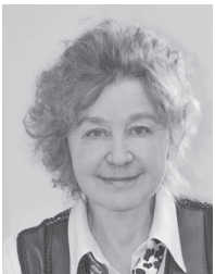
ЧЕКАЛЕНКО Л.Д., завідувач кафедри зовнішньої політики і дипломатії Дипломатичної академії України при МЗС України, д.і.н., професор