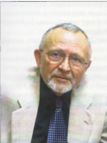
Василь Ткаченко доктор істор. наук, професор, гол. наук. співроб. Інституту всесвітньої історії НАН України, член-кореспондент НАПН України, м. Київ

Н ещодавно наш лексикон поповнився новим політологічним образом-поняттям: «чорні лебеді». Зазвичай вважалося, що лебеді можуть бути лише білими. Однак голландська експедиція в Австралію 1697 року виявила популяцію чорних лебедів. У наші дні «чорний лебідь» – це метафора, що уособлює в собі рідкісні й важкопрогнозовані події, котрі мають значні наслідки