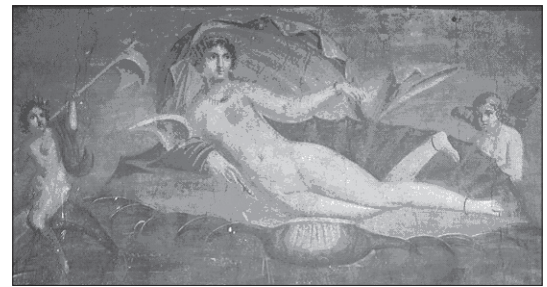
Мал. 6. Афродіта у супроводі Нерейди, дельфіна й Ероса. Помпейська фреска (I століття по Р.Х.). З колекції Неаполітанського національного археологічного музею (Museo Archeologico Nazionale di Napoli) 15 .

У світлі всього вищесказаного я вважаю, що аналіз змісту АВ 37–39, у