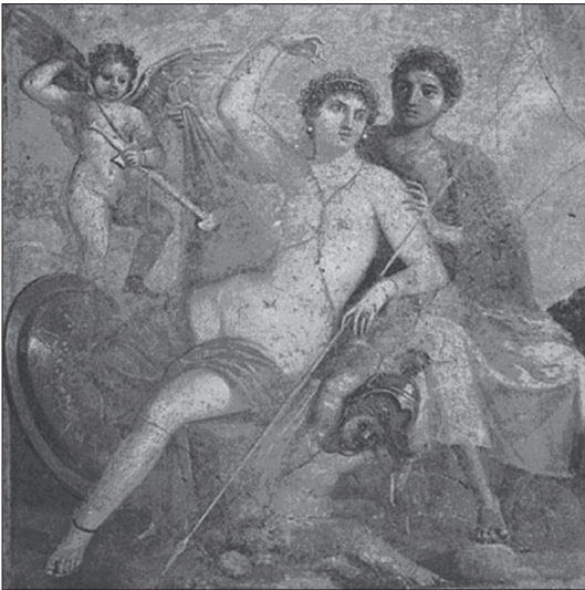
Мал. 3. Афродіта, Арес, Ерос і, ймовірно, Фобос. Помпейська фреска (бл. I століття по Р.Х.). З колекції Неаполітанського національного археологічного музею (Museo Archeologico Nazionale di Napoli).

Не слід також забувати, що у давньогрецькій міфологічній традиції Афродіта була дружиною або коханкою бога війни Ареса, від якого вона народила Фобоса й Деймоса, котрі персоніфікували страх та жах і вважалися постійними супутниками бога війни [Homerus 1913, VIII, 266; Hesiodus 1856, 934; Scythinus 1923, 195; Homerus 1901, iv, 440; xiii, 299; Scholia 1935, iii, 26; Cicero 1933, iii, 23].