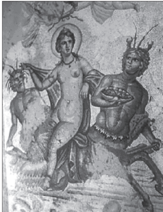
Мал. 4. Афродіта й іхтиокентаври. Греко-римська мозаїка (бл. I століття до Р.Х. – II століття по Р.Х.). З колекції Газіантєпського музею (Gaziantep Museum, Turkey) 13 .

Немає ніяких сумнівів у тому, що в останній епіграмі йдеться про згаданий вище прибережний храм Арсиної, у якому цариця ототожнювалася з Афродітою-Свплією або Афродітою-Зефірідою – покровителькою мореплавців 12 [Anthologia 1911, I, 116; АВ, 39; Strabo 1899, XVII, I, 16; Hyginus 1992, II, 24].