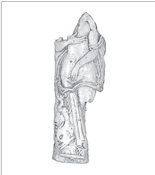
Мал. 5. Афродіта і дельфін. Різьба по кістці (II століття по Р.Х.). З колекції Греко-римського музею в Александрії (The Greco-Roman Museum, Alexandria) 14 .

Паралель між Арсиною і морською Афродітою можна помітити й у АВ 37. Згадаймо, що ліру, згодом присвячену Арсиної, приніс саме дельфін. При цьому не слід забувати, що цю морську істоту можна пов'язати не лише зі співцем Аріоном [Herodotus 1899, I, 23–24; Plutarchus 1928, 18, Pausanias 1973, III, XXV, 7; IX, XXX, 2], котрий згадується в епіграмі, а й з народженою в морі Афродітою. В античній образотворчій традиції дельфін нерідко з'являється при народженні богині.