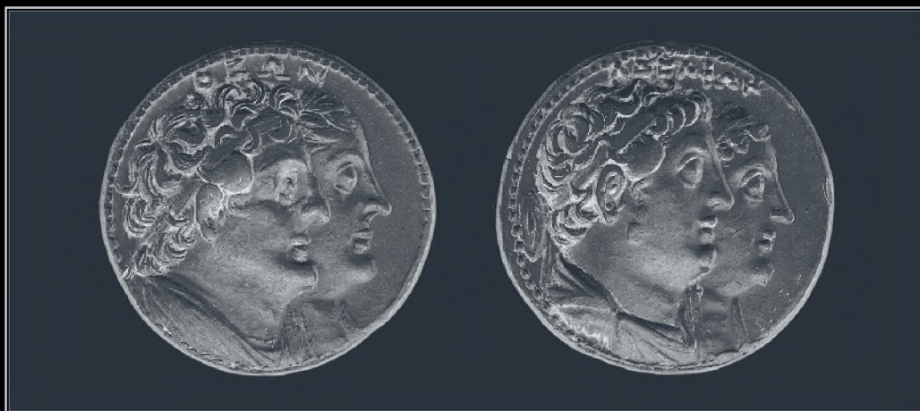
Илл. 5. Октодрахма Птолемея II. На аверсе: парный портрет Птолемея II и Арсинои II. На реверсе: парный портрет Птолемея I и Береники I

так и после смерти царицы 52 . Для самого же александрийского властителя, судя по всему, во главе угла стоял сам факт осуществления физической близости с сестрой, не нуждавшийся в чрезмерной сакрализации обретенного им эпитета. По этой причине царь довольствовался констатацией свершившегося инцеста, в итоге войдя в историю именно как физический супруг собственной сестры; что, вероятно, его вполне устраивало.