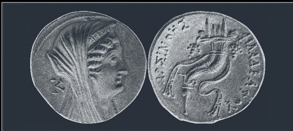
Илл. 4. Золотая пентеконтадрахма (Александрия, 270–246 гг. до н.э.): одиночное изображение Арсиной II с рожком Амона как символом обожествления

в особенности сближало усыновление ею детей Птолемея от первого брака (Schol. Theocr. XVII. 128–130) 45 ; этот акт напоминал взятие на воспитание Исидой Анубиса, порожденного от случайной связи Осириса с Нефтидой (Plut. De Is. 14; 38; 44) 46 .