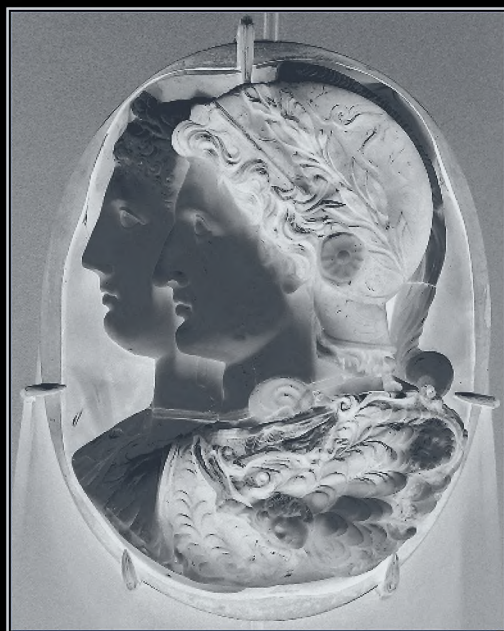
Илл. 1. Камея Гонзага (Александрия, III в. до н.э.): парное изображение Птолемея II и Арсинои II с элементами древнегреческого апофеоза

за царя Лисимаха, одного из диадохов Александра Македонского. Дворцовые интриги царицы, призванные приблизить ее первенца, Птолемея, к престолонаследию в обход старшего царского сына, Агафокла 3 , окончились гибелью Лисимаха и крахом его империи в 281 г. Самой царице удалось сохранить свою жизнь лишь при помощи трюка с переодеванием (Polyaen. VIII. 16). С целью удержаться у власти в принадлежавшей покойному супругу Македонии, Арсиноя в 280 г. вышла замуж за своего единокровного брата, Птолемея Керавна, провозглашенного царем упомянутой страны. Этот кратковременный брак окончился убийством двух младших сыновей царицы на глазах у матери и изгнанием ее самой из пределов Македонии 4 .