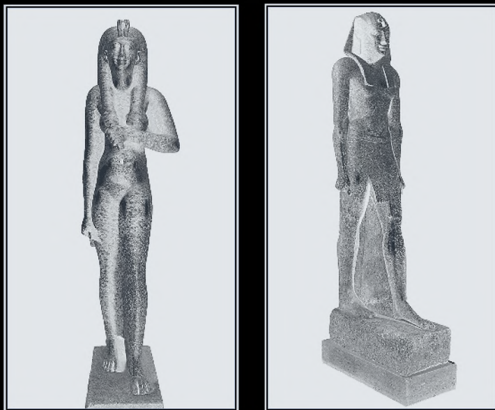
Илл. 2. Парная скульптурная композиция (Гелиополь, 270–246 гг. до н.э.): Птолемей II и обожествленная Арсиноя II в образе древнеегипетских властителей

этот раз египетской божественной супружеской парой: Осирисом (Сараписом 19 ) и Исидой (ср. Diod. I. 21, 27; Plut. De Is. 27) 20 .