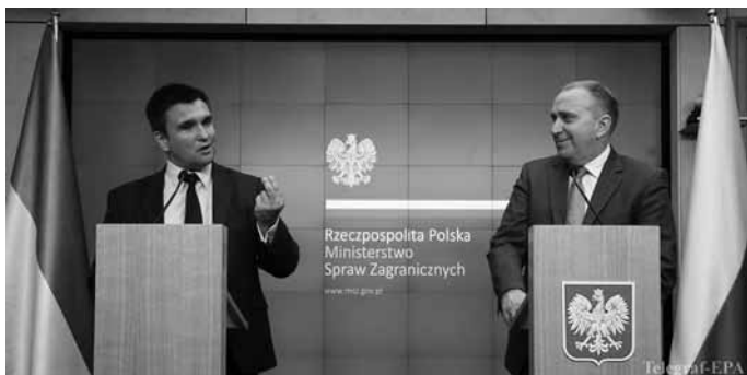
На брифінгу у Варшаві влітку минулого року очільник українського МЗС Павло Клімкін висловив надію на підтримку Польщі в підготовці до майбутньої угоди про вступ України до ЄС

Росії, яка веде неоголошену війну проти суверенної України. Сполучені Штати 12 вересня 2014 р. до списку санкціонованих додали Сбербанк Росії, Транснефть, Сургутнефтегаз, Газпром нефть, Лукойл, Газпром, а також п'ять оборонних високотехнологічних державних корпорацій, зокрема Ростехнології.