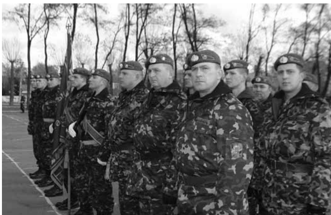
Військові об'єднаного батальйону (УкрПольбат)