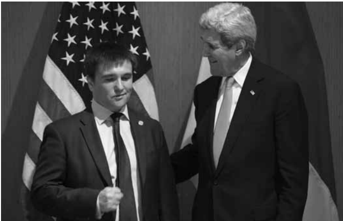
Держсекретар США Джон Керрі та Міністр закордонних справ України Павло Клімкін під час зустрічі в Анталії

час Канада надає широку гуманітарну допомогу Україні: в українські морські порти прибуло три кораблі з канадською гуманітарною допомогою, а це – 54 морських контейнери, в яких – 67 тис. пар взуття і 27 тис. теплих комплектів верхнього одягу. Крім того, канадці направили в Україну літак з мобільними госпіталами [8].