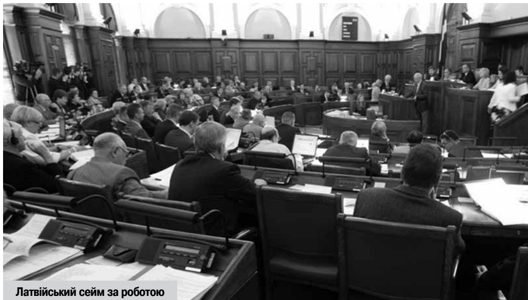
Латвійський сейм за роботою

Канада підтримала Україну в її протистоянні агресору. Керівник канадського уряду Стівен Гарпер 19 грудня 2014 р. оголосив про запровадження додаткових економічних санкцій і заборони на в'їзд для 20 російських і українських осіб, а також про нові обмеження на експорт до Росії технологій розвідки і видобутку нафти. Канадська сторона запевнила у своїй підтримці України, зокрема шляхом надання військової допомоги і військового співробітництва, що було закріплено в Декларації про наміри міністерств оборони України та Канади 8 грудня 2014 року. Водно-